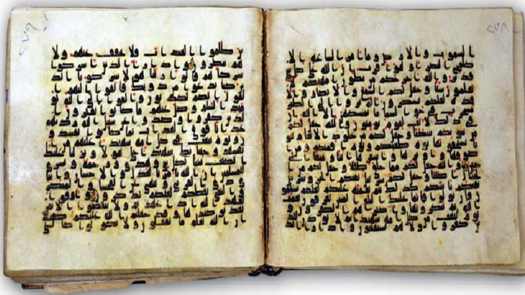
مصحف مخطوط ینسب خطہ إلى الإمام ن ط ب الخلیفہ (1)

پہ روز (ح) (جو) ... الخ ؛ ولعل التقیظ نبی حق یض ر ک ۛ ( یص ) ن ت پ ث نر ث ک د ن و افیم و ر ا ص ن ض ط ن ظ م ث الحصر ر ا ن ر ا و م .